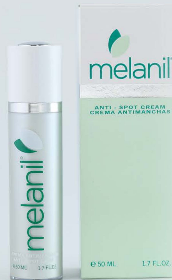
Меланил крем 50мл От пигментных пятен