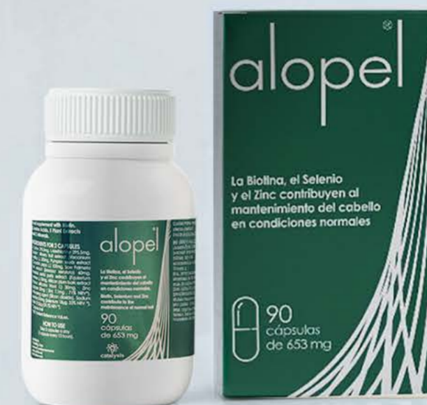
Алопель капсулы N90 от выпадения волос