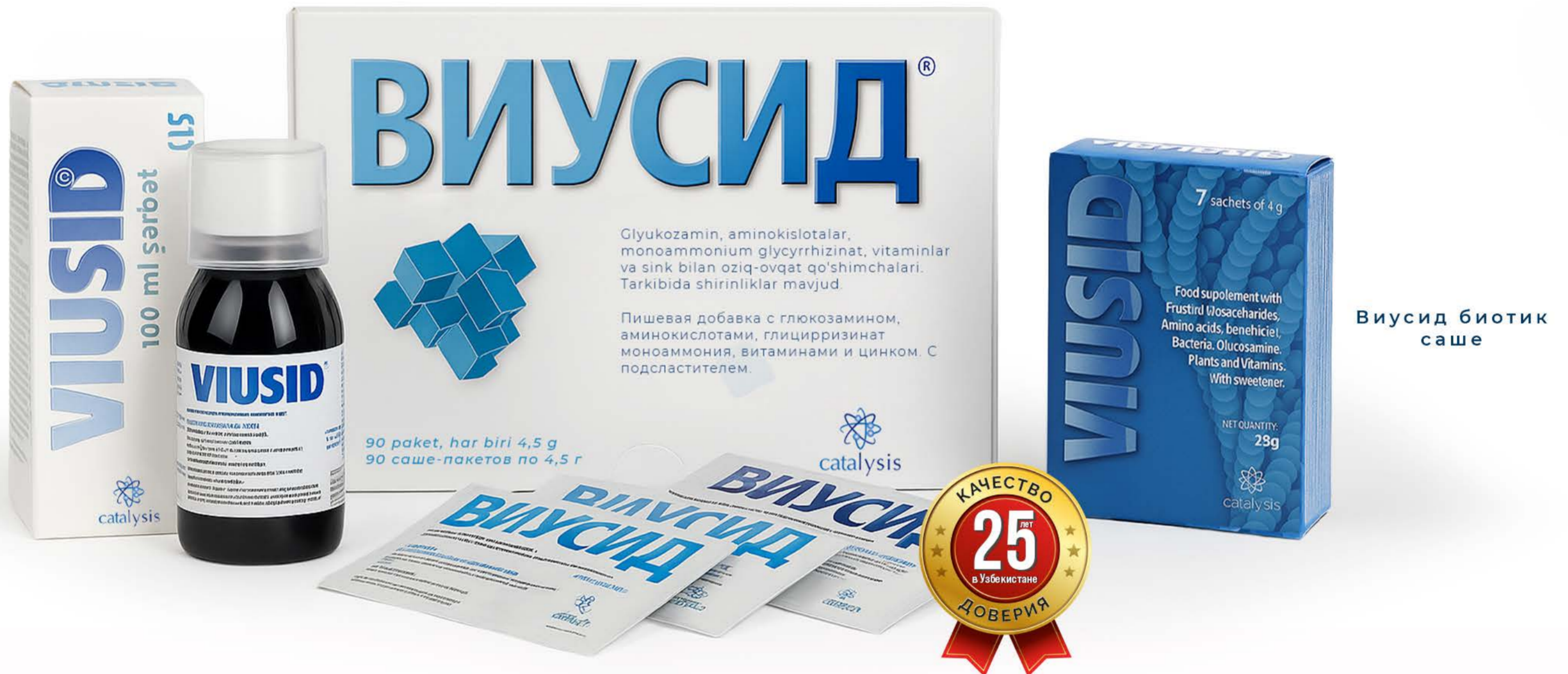
Виусид 150мл сироп