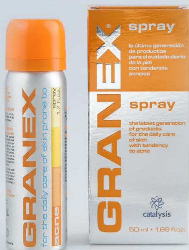
Гранекс пенка 50мл От акне и угрей