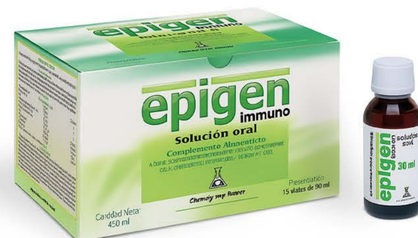
Эпиген иммуно 30мл №15