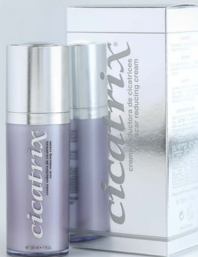
Цикатрикс крем 30мл От шрамов и рубцов