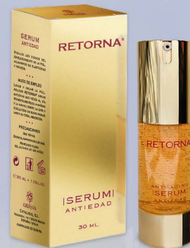
Реторна сыворотка 30мл От морщин