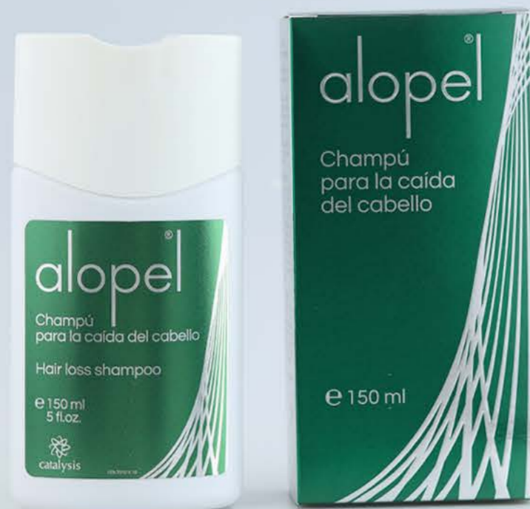
Алопель шампунь 150мл от выпадения волос