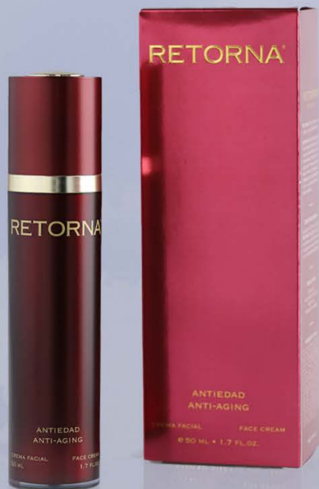
Реторна крем 50мл От морщин

Сыворотка RETORNA разработанный как дермокосметическое решение для уменьшения признаков старения кожи и повышения ее эластичности и упругости.