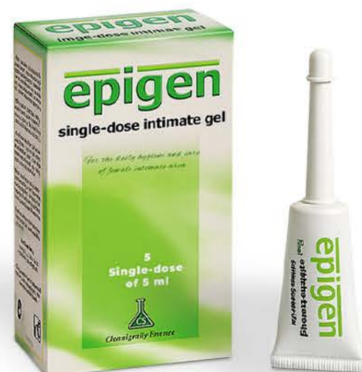
Эпиген моно-доз 5мл №5