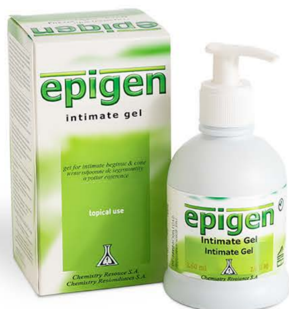
Эпиген гель 250мл