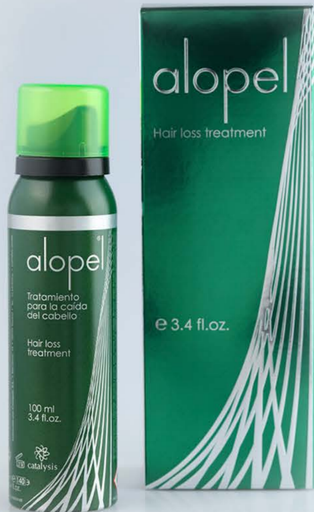
Алопель пенка 100мл от выпадения волос