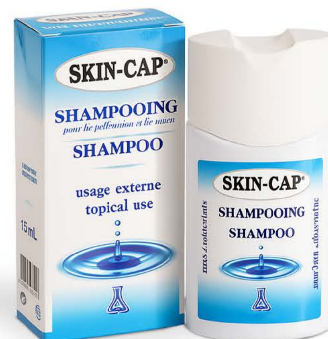
Скин-кап шампунь 150мл

Уникальная линейка на основе натуральных компонентов для лечения и профилактики гинекологических и урологических заболеваний