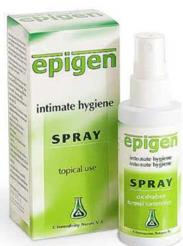
Эпиген спрей 60мл

Уникальная линейка на основе натуральных компонентов для лечения и профилактики гинекологических и урологических заболеваний