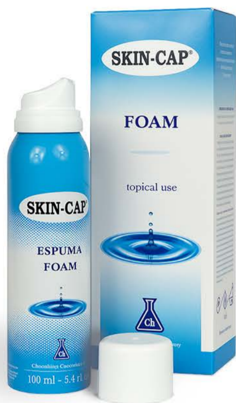
Скин-кап пенка 100мл