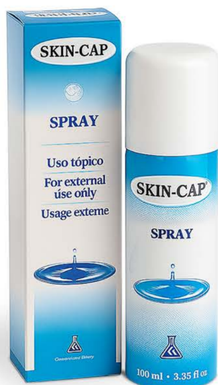
Скин-кап спрей 100мл