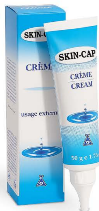
Скин-кап крем 50гр